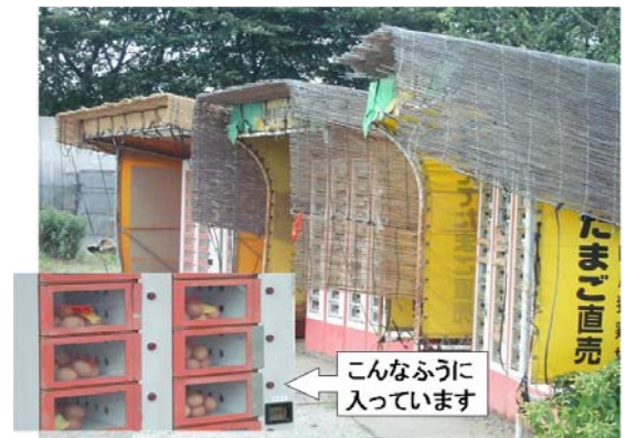
自動販売機による卵の直販

また、直販の形態の一つとして、鶏卵の自動販売機を持つところもあります。お気に入りの養鶏場で、冷蔵された卵が24時間いつでも買えるため、利用者に好評です(写真)。